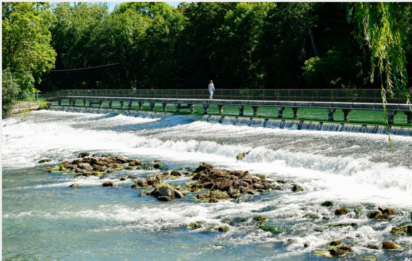
Vue sur le déversoir et l'île Olive (Olivier Douard)